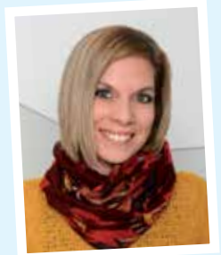
Referentinnen: Sandra Klötzer

Anmeldung: Auf Seite 21 oder online (siehe unten)